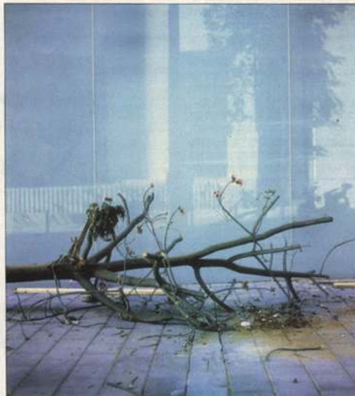
גליה ממאדים.

ביקורת 72 מחייאונים 73 גלריות 73 חללי תצוגה, ברתבי הארץ, אירועים 74